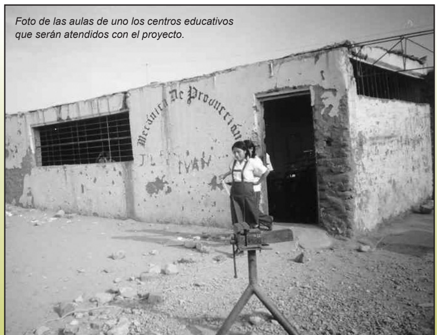
Foto de las aulas de uno de los centros educativos que serán atendidos con el proyecto.

Dotaremos de adecuada infraestructura y equipamiento a los talleres técnicos de Mecánica de Producción e Industria Alimentaria en la Institución Educativa "José María Arguedas" y a los talleres de Técnico Dental e Industria Alimentaria en el Centro de Educación Ocupacional "Víctor Raúl Haya de la Torre"; capacitaremos a la plana docente en un nuevo